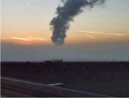
Ist das KKI schon weg?? (von: Florian Schwaiger)