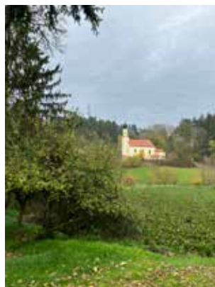
Der Herbst in Unsbach (von Marianne Schwaiger)