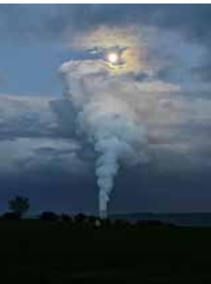
Vollmond über Essbach