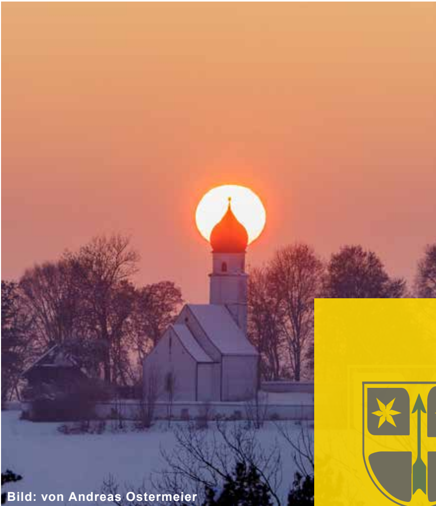
45. Jahrgang | Nr. 533