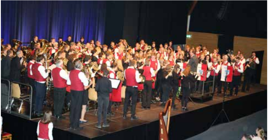
Bild: Die drei Blaskapellen gemeinsam auf der Bühne.

Ein musikalisches Erlebnis der besonderen Art boten am 15. November 2022 die Blaskapelle Essenbach, das Sinfonische Blasorchester Geisenhausen und die Stadtkapelle Landshut in der ESKARA Essenbach. Die begeisterten Zuhörer aus dem Landkreis und der Stadt erfreuten sich an der musikalischen Vielfalt aus Film, Oper, Musical, Pop und Rock. Zum krönenden Abschluss standen alle 130 Musiker auf der Bühne und spielten gemeinsam den „Böhmischen Traum“ und den Marsch „Mein Heimatland“. Lob von allen Seiten erfuhr der Blasmusikverein Essenbach als Gastgeber mit der Aufforderung, Veranstaltungen dieser Art zu wiederholen.