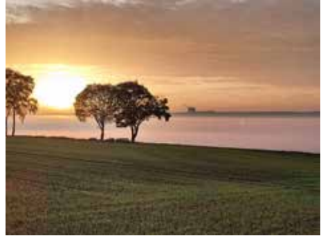
Sonnenuntergang in Unterwattenbach