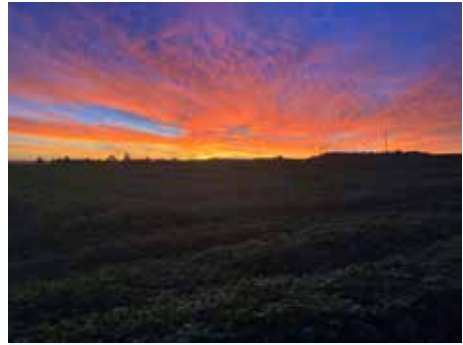
Alpenglühn über Mirskofen