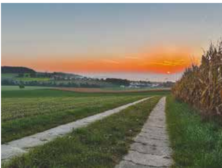
Sonnenaufgang über Unterwattenbach

Liebe Mitbürgerinnen und Mitbürger, liebe "Hobbyfotografen", der Herbst hat sich von seiner tollsten Farbenpracht gezeigt und Sie haben uns viele wunderschöne Fotos geschickt, die wir hier einmal präsentieren wollen. Wir bedanken uns für jedes einzelne Foto und freuen uns auf Ihre kommenden Bilder zum Thema "Winter".