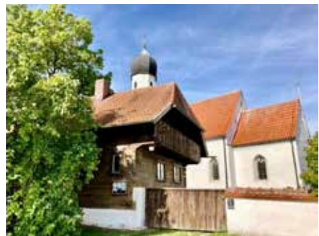
Goldener Herbst (von: Alois Brunner)