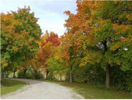
Auffahrt zum Friedhof in Mettenbach