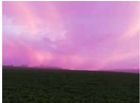
Farbenwunder (von: Renate Brams)