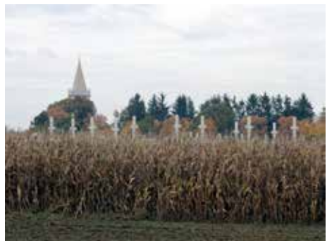
Neuer Friedhof von Essenbach?? (von: Karel van der Gucht)