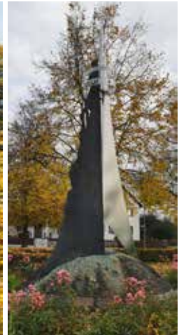
Pausenhof der Mittelschule Essenbach und Pflügerdenkmal Altheim

Liebe Mitbürgerinnen und Mitbürger, liebe "Hobbyfotografen", der Herbst hat sich von seiner tollsten Farbenpracht gezeigt und Sie haben uns viele wunderschöne Fotos geschickt, die wir hier einmal präsentieren wollen. Wir bedanken uns für jedes einzelne Foto und freuen uns auf Ihre kommenden Bilder zum Thema "Winter".