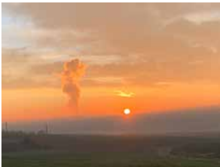
Sonnenaufgang über Essenbach