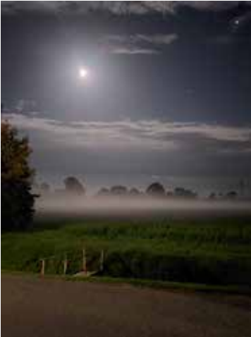
Brücke im Nebel