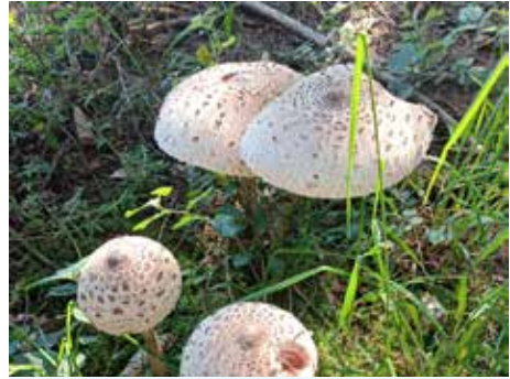
Die ersten Parasol Pilze im Wald (von Waltraud Ableitner)