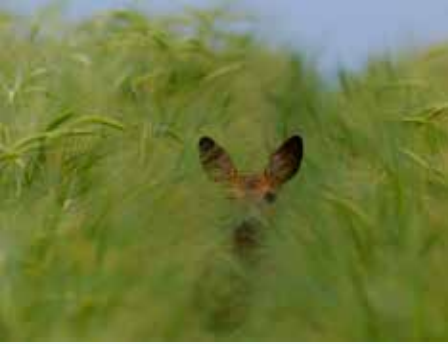
Reh entdeckt! (von Moritz Bichlmaier)