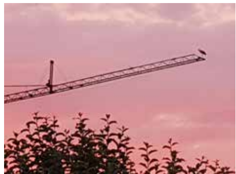
Storch im Abendrot (von Rudolf Frank)