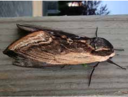
Totenkopfschwärmer - Besuch aus Mittel-europa (von Franz Wirth)