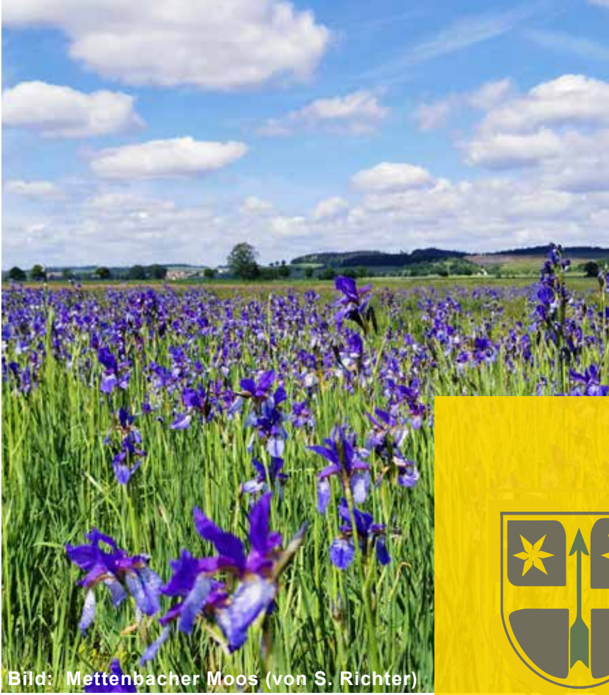
Bild: Mettenbacher Moos