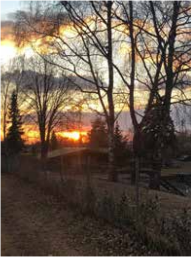
"Sonnenuntergang am Weiher" von Monika Obermeier