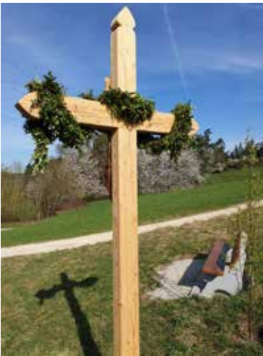
"Feldkreuz zwischen Unsbach und Oberwattenbach" von H. Hadersbeck