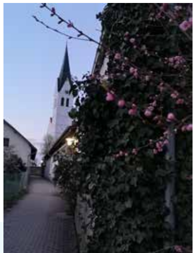
"kirchliches Frühlingserwachen" von Alexandra Poggenborg