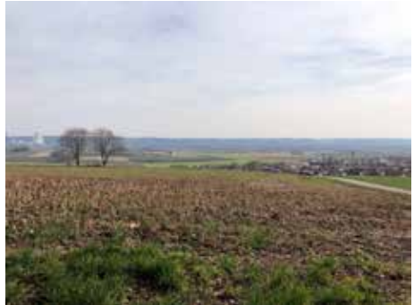
"Frühling liegt in der Luft" von Sandra Wimmer