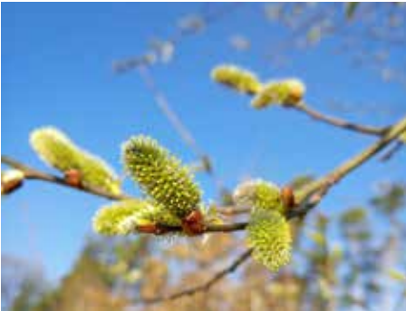
"Frühlingserwachen" von Thomas Wiesbeck