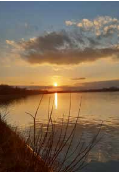
"Sonnenuntergang über dem Altheimer Stausee" von Frau Arbesmeier