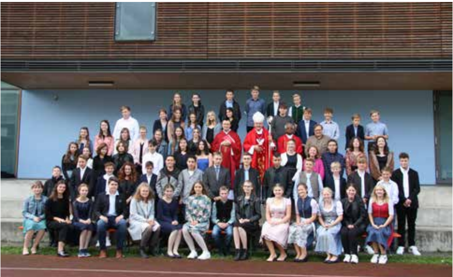
65 Firmlinge aus der Pfarreiengemeinschaft Essenbach/Mettenbach/Mirskofen