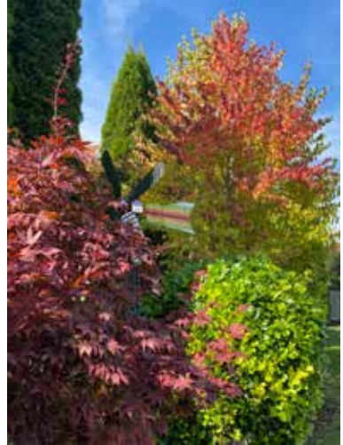
"Herbsteinzug im Garten" von Petra Schwaiger

Fotoaufgabe: "Der Herbst hat die tollsten Farben!"