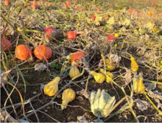
"Herbstfrüchte" von Anton Ableitner