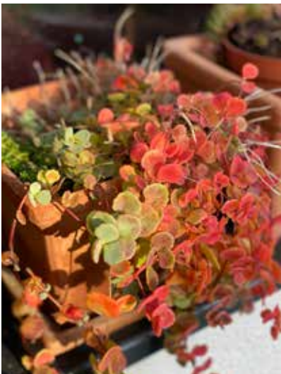
"Herbstfarben" von Jörn Sieke

Schicken Sie uns IHRE BILDER für die nächste Ausgabe! An: gemeindeinfo@essenbach.de