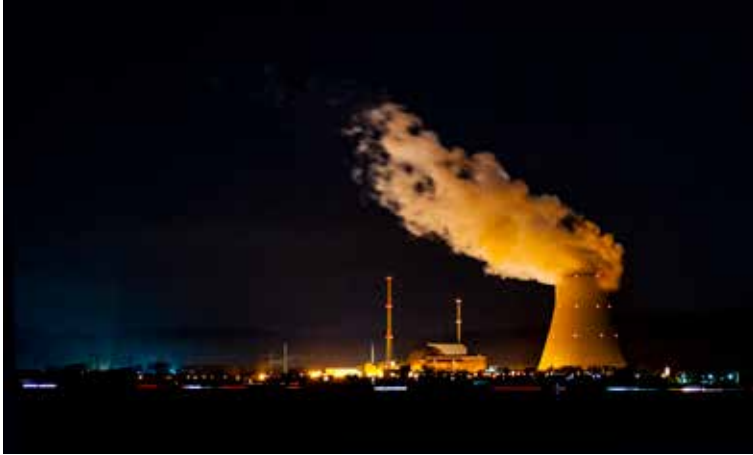
"Kernkraftwerk" von Anton Kolbinger

Fotoaufgabe: "Der Herbst hat die tollsten Farben!"