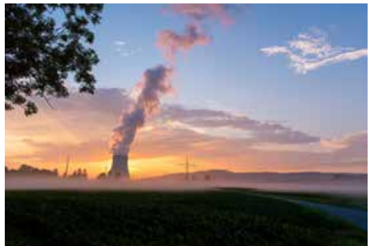
"KKI bei Sonnenaufgang" von Tobias Krams