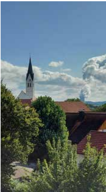
"St. Peter Kirche in Altheim" von Tobias Daffner

Fotoaufgabe: "Der Herbst hat die tollsten Farben!"