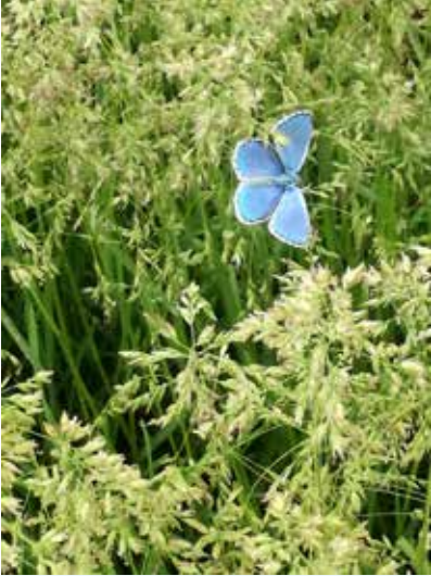
"Schmetterling" von W. Ableitner