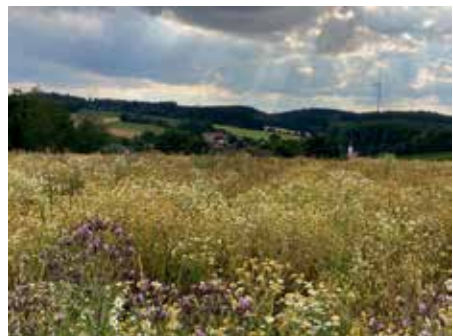
"Blumenwiese" von M. Altmann