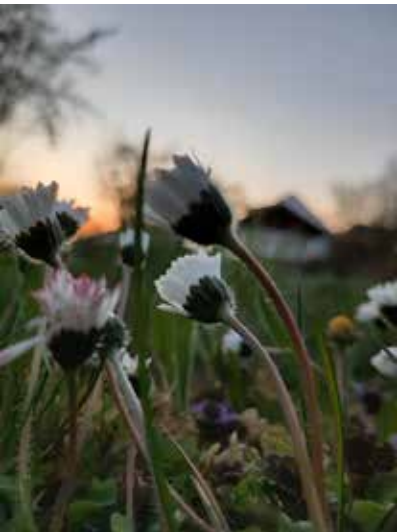
"Blume" von Ch. Weindl