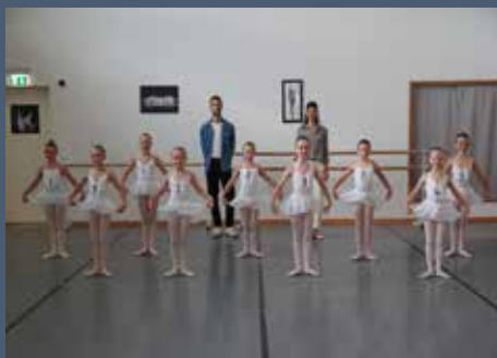
Ballettklasse 1 A