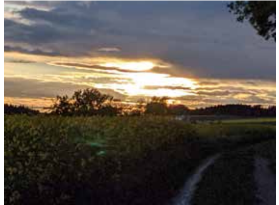
"Sonnenuntergang" von F. Hanglberger