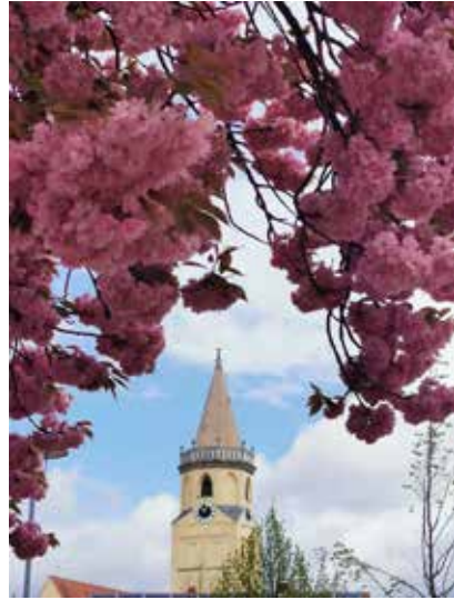
Kirche in Rosa Pracht von S. Richter