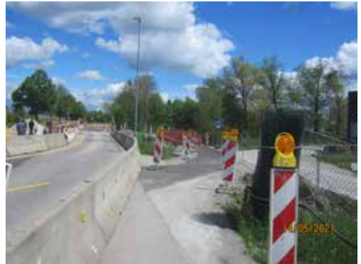
Erneuerung Wellstahldurchlass Staatsstraße B11