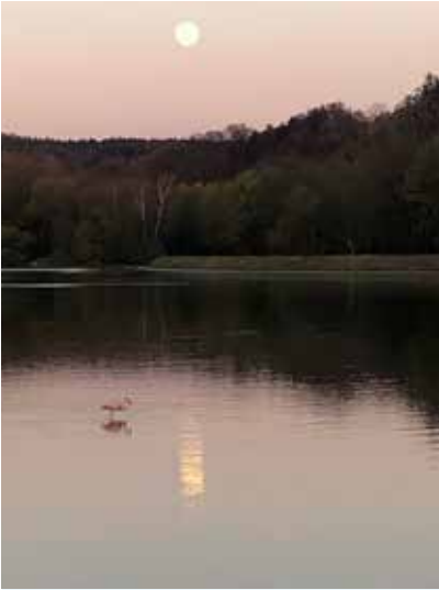
Flamingo in Oberahrain von S. Wischinski