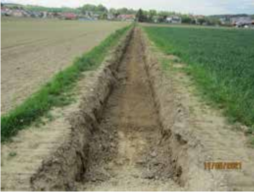
Baugebiet Mirskofen Süd – Teil III