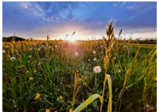
Feld in Sonnenuntergangsstimmung von S. Dechantsreiter