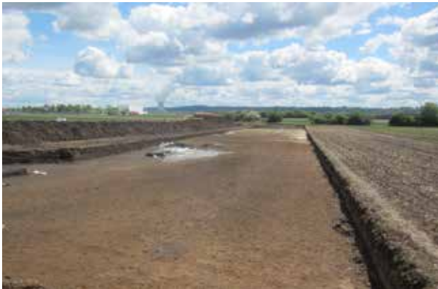
Bauprojekt Sondergebiet Savigneuxplatz (neues Landratsamt)