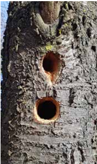
"Wohnung frei" von S. Burgmeier