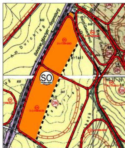
Flächennutzungsplan Markt Essenbach 21. Änderung

Der Marktgemeinderat hat in seiner öffentlichen Sitzung am 26.11.2019 beschlossen, für das oben dargestellte Gebiet einen Bebauungs- und Grünordnungsplan aufzustellen. Hierzu ist der Flächennutzungsplan im Parallelverfahren zu ändern. Der Vorentwurf wurde in der öffentlichen Marktgemeinderatssitzung am 14.04.2020 zur Auslegung gebilligt.