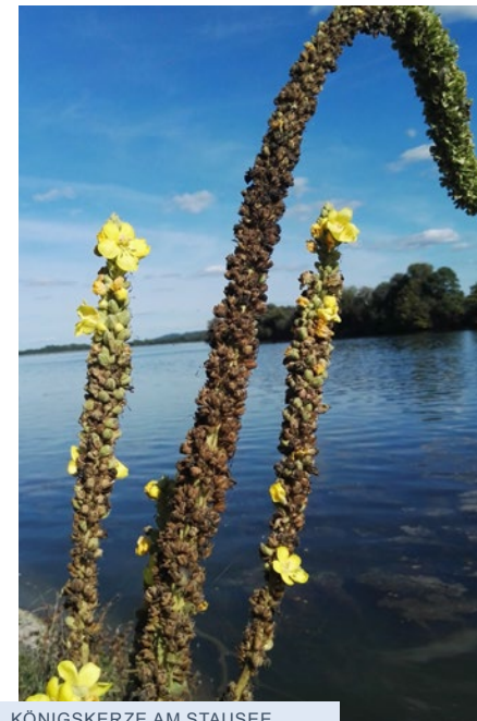
KÖNIGSKERZE AM STAUSEE VON SIEGLINDE RICHTER