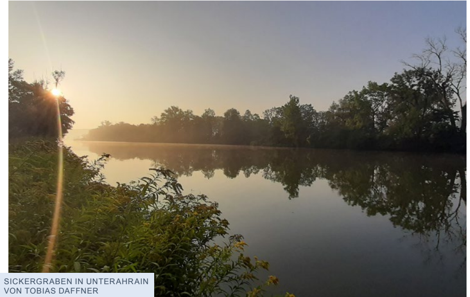
SICKERGRABEN IN UNTERAHRAIN VON TOBIAS DAFFNER