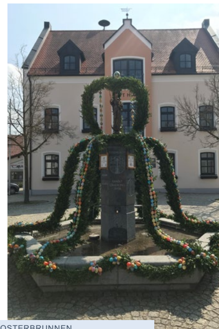
OSTERBRUNNEN VON MANUELA GELTL