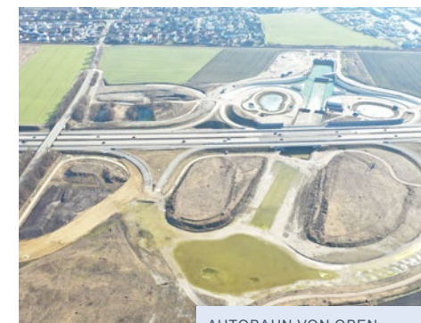
AUTOBAHN VON OBEN VON ROLAND KOLLMEDER