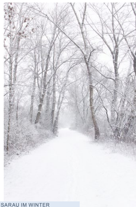
ISARAU IM WINTER VON FRANZ GROBMEIER