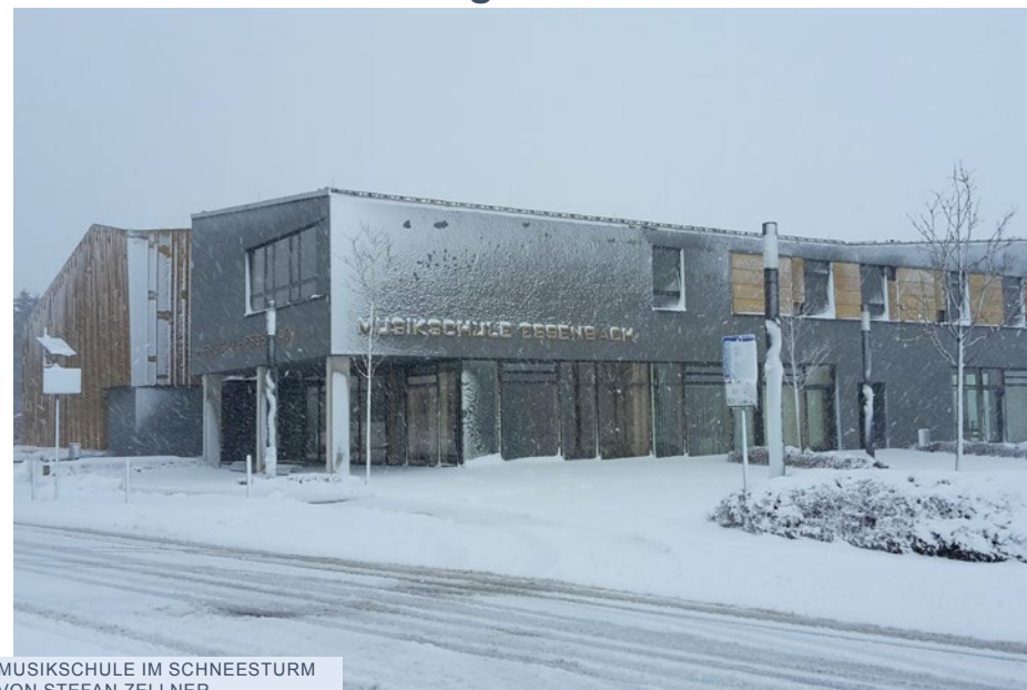
MUSIKSCHULE IM SCHNEESTURM VON STEFAN ZELLNER