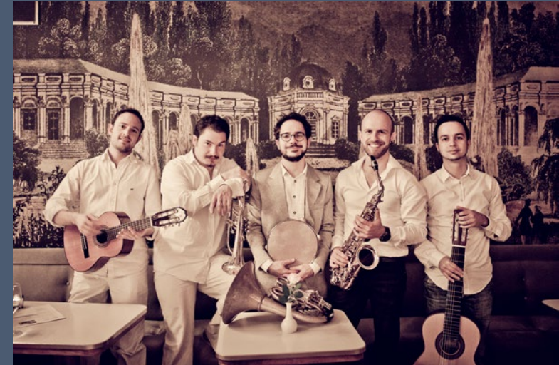
Spielfreude, Virtuosität und gute Laune zeichnen die fünf Musiker von „Bavaschôro“ aus

Als Mitglieder der „Unterbiburger Hofmusik“ erweitern sie das klassische Choro-Repertoire durch Einflüsse der bayerischen Volksmusik und des Jazz. Erweitert um diesen weiteren kulturellen Einfluss wird die Musik von „Bavaschôro“ zum Sinnbild für musikalische Lebendigkeit und Spielfreude.