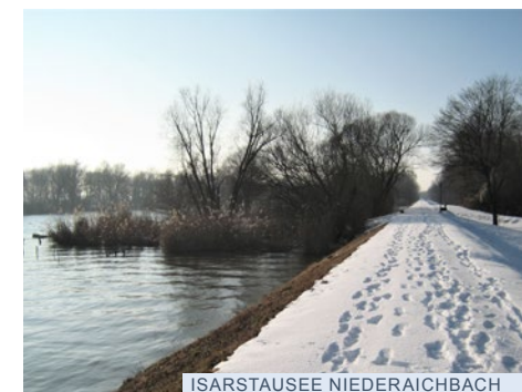
ISARSTAUSEE NIEDERREICHBACH VON ANTON MOISSL