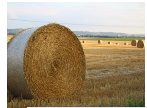
BLICK VON MIRSKOFEN RICHTUNG LANDSHUT VON MANUEL GELTL