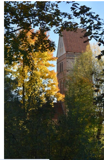
KIRCHE ALTHEIM VON ANGELA BIEWER