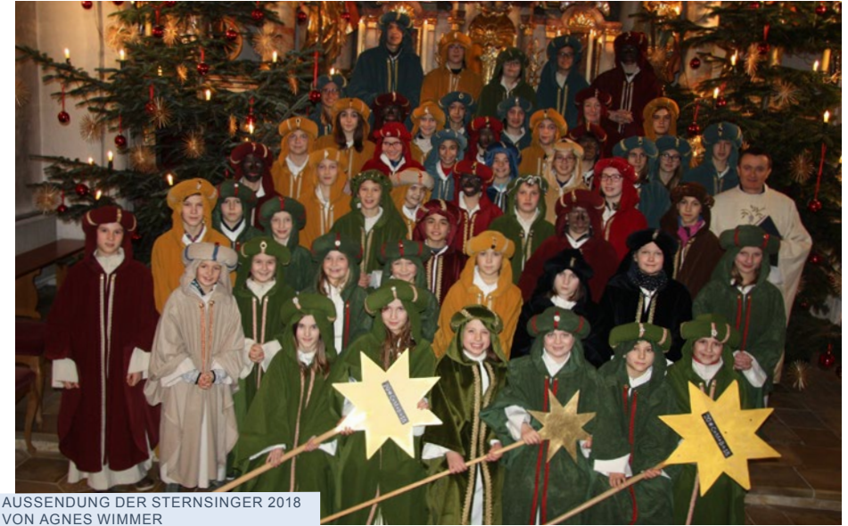
AUSSENDUNG DER STERNSINGER 2018 VON AGNES WIMMER