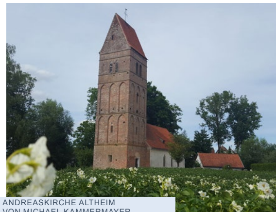
ANDREASKIRCHE ALTHEIM VON MICHAEL KAMMERMAYER

Schicken Sie uns IHRE BILDER für die nächste Ausgabe! An: haeckl@essenbach.de