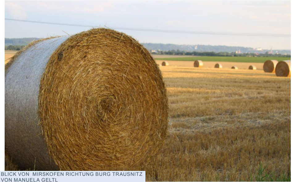
BLICK VON MIRSKOFEN RICHTUNG BURG TRAUSSNITZ VON MANUELA GELTL